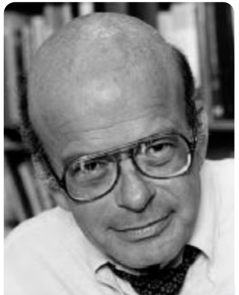
David L. Rosenhan

“Sólo cuando la locura deja de ser vestida de etiqueta queda al descubierto su verdadero rostro”.