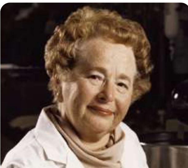
Gertrude Belle Elion