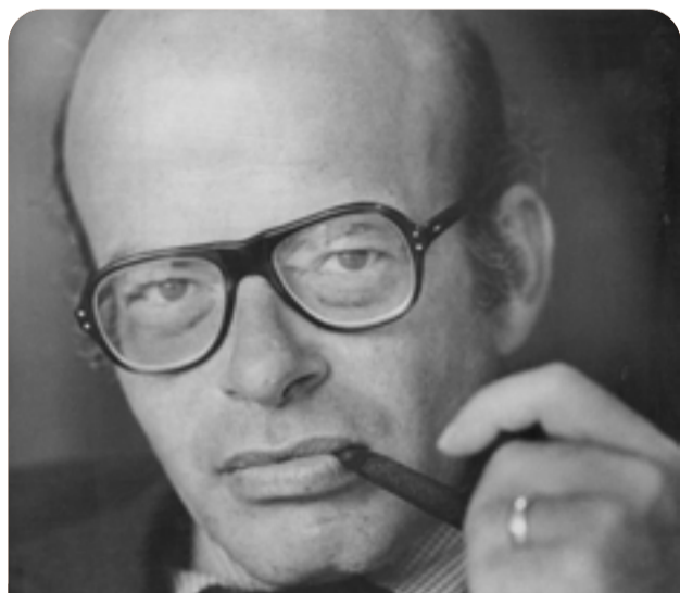
David L. Rosenhan