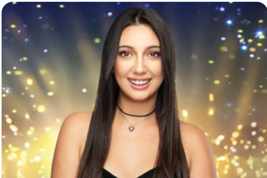
Yuval Raphael, superviviente del atentado del 7-0, representante de Israel en el Festival de la Canción de Eurovisión 2025

Aun así, artistas como Gadot, Spektor, Sandler, Matisyahu y Golan eligen hablar. No lo hacen porque no temen, sino porque sienten que el silencio sería aún peor. “Si me callo, me borro a mí misma”, dijo Eden Golan tras Eurovisión.