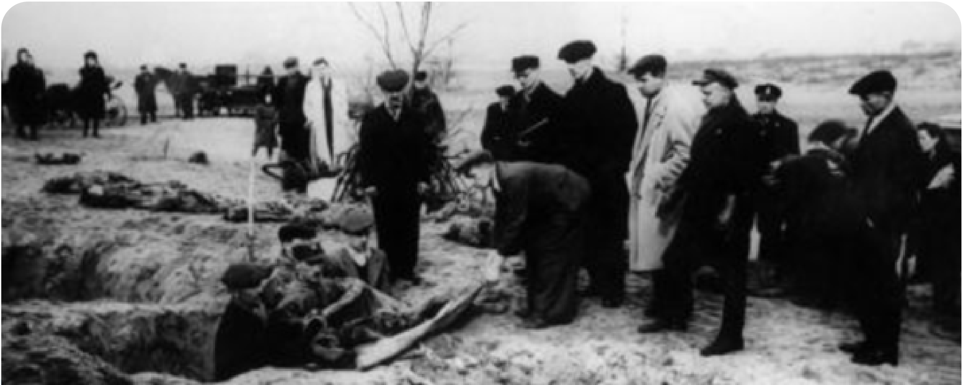
Civiles y soldados recuperan cuerpos de las fosas comunes tras la liberación

venta o reutilización—. La gran mayoría de los demás prisioneros había sido evacuado o asesinado en los días previos a la llegada soviética.