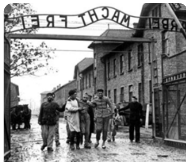
Liberación de Auschwitz

CONMEMORAMOS EL FIN DEL MAYOR GENOCIDIO DE LA HISTORIA