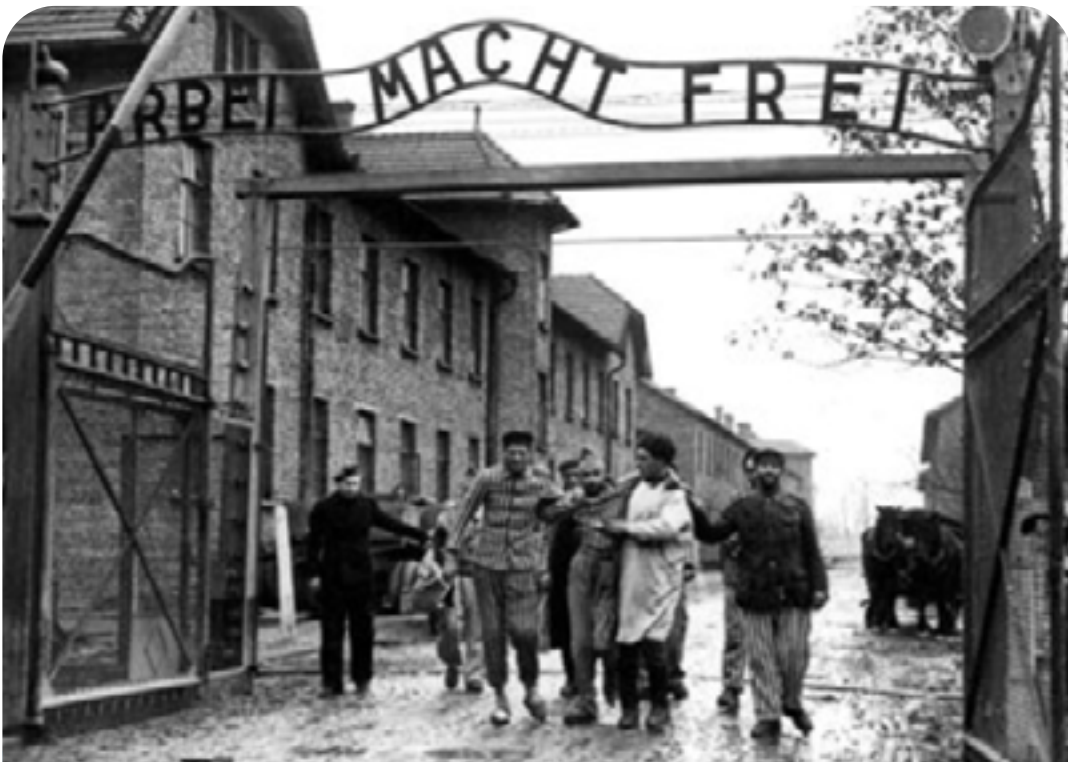
Un médico, en el centro, con la División de Fusileros número 322 del Ejército Rojo, camina con un grupo de supervivientes por la entrada del recién liberado campo de concentración Auschwitz I, en enero de 1945. El Ejército Rojo liberó el campo el 27 de enero de 1945. Sobre la puerta de entrada está el lema “Arbeit macht frei”, que se traduce como “El trabajo te hace libre”.

A medida que el avance del Ejército Rojo soviético se aproximaba al este de Europa en enero de 1945, los nazis intentaron borrar las huellas de sus crímenes. Entre los días 17 y 21 de enero, obligaron a unos 60.000 prisioneros —aquellos que aún podían caminar— a marchar hacia el oeste en lo que se conoció como “marchas de la muerte”, una evacuación brutal que causó miles de muertes por agotamiento, frío extremo, hambre y ejecuciones sumarias. Cuando las tropas soviéticas finalmente entraron en el complejo de Auschwitz el 27 de enero de 1945, encontraron un escenario espeluznante: alrededor de 7.000 prisioneros, extremadamente débiles y enfermos, permanecían en los barracones, junto con evidencia física incontestable del genocidio perpetrado allí —montañas de ropa, zapatos, gafas y hasta toneladas de cabello humano que los nazis habían arrancado a sus víctimas y preparado para su