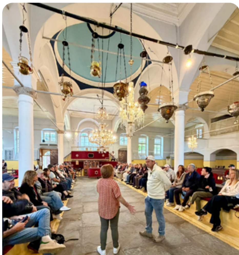
Sinagoga ROMANIOTA en Ioanina