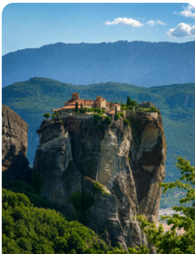
Monasterios colgantes en Meteora - Grecia

Fue tremendamente emocionante conocer el lugar donde nació mi papá, mis tíos y mis abuelos. También logramos permiso para ingresar, y hubo momentos muy conmovedores que, como dije, emocionaron a muchos de los que asistimos a este viaje.