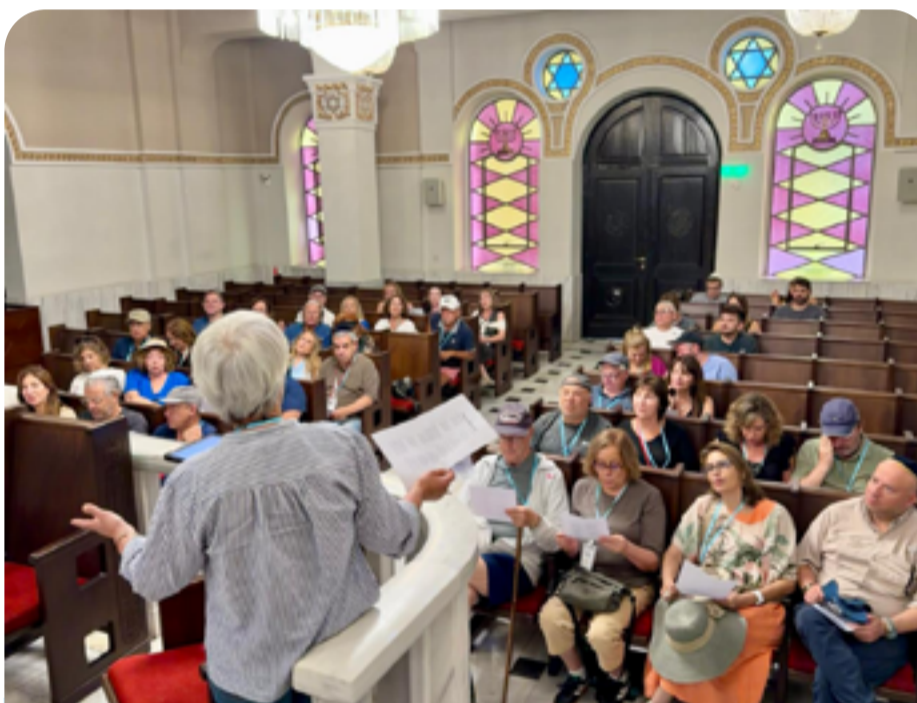
Sinagoga de Salonica cantando en Sefaradi “Adio kerida”