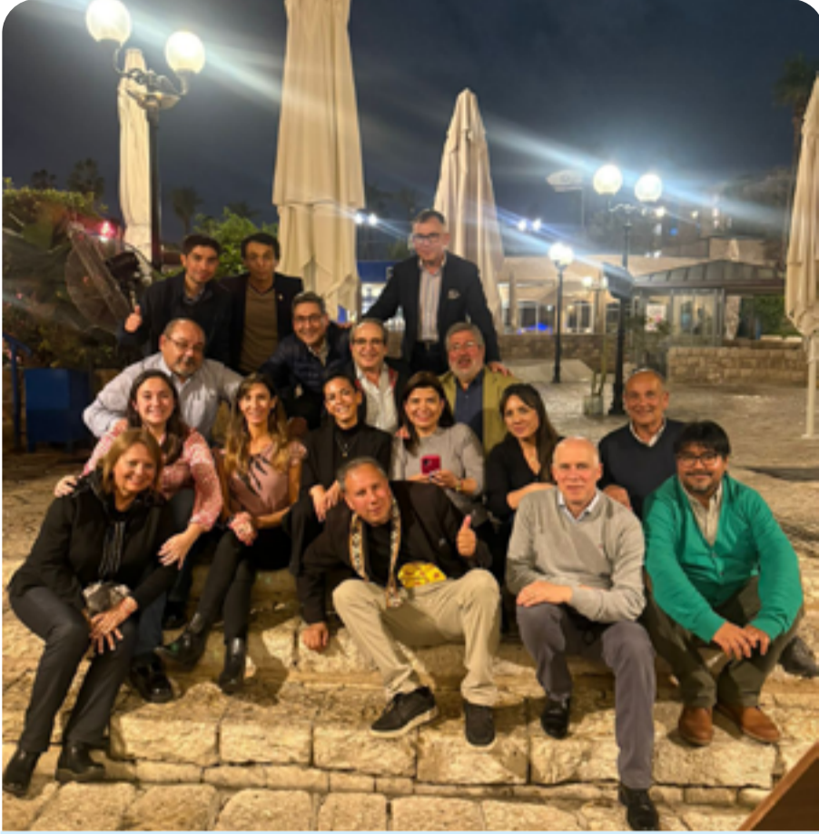
Todos los viajeros en barrio Yaffo

frente al error y al aprendizaje”, afirma. Su meta ahora es promover en Chile el pensamiento crítico y una cultura escolar orientada a la investigación desde edades tempranas.