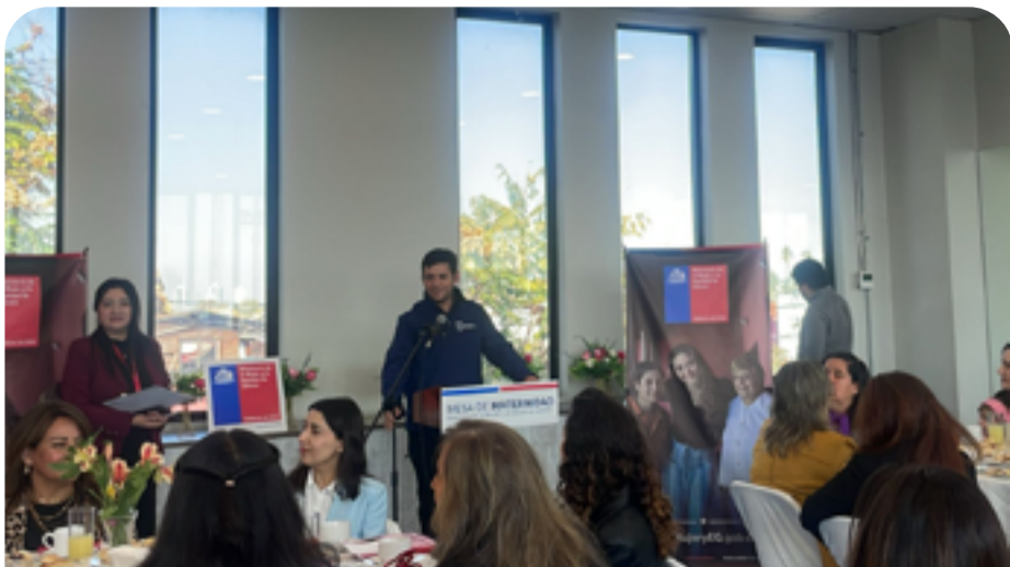
Alcalde de la comuna de independencia, Sr. Agustín Iglesias