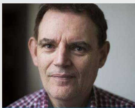
Por: POR ISAAC CARO, académico Universidad Alberto Hurtado

Cabe mencionar que estas relaciones y la presencia iraní han sido vistas con preocupación por Estados Unidos, la Unión Europea e Israel, especialmente por el aumento de capacidades militares de Irán y por el desarrollo de un programa nuclear con la capacidad de desarrollar armas nucleares. Esta inquietud es todavía mayor a partir de la invasión rusa de Ucrania, debido a la relación estratégica que se ha desarrollado entre Teherán y Moscú, así como su creciente influencia en la región latinoamericana.