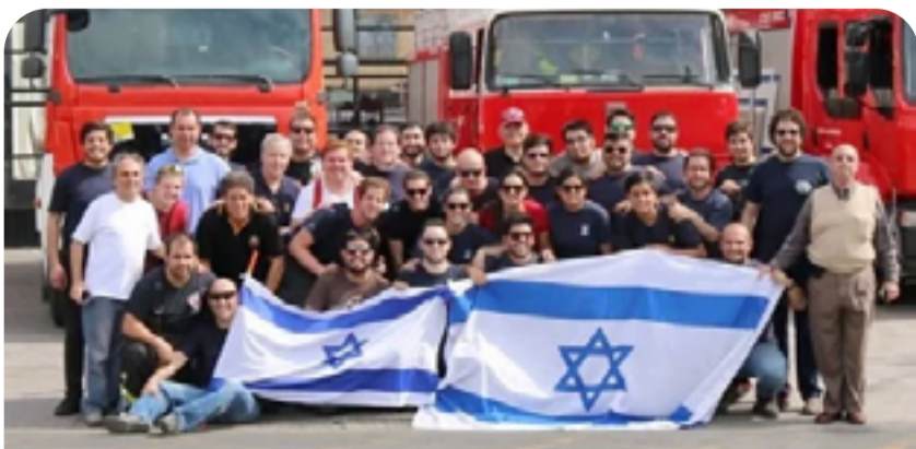
Quinta Compañía del Cuerpo de Bomberos de Ñuñoa, "Bomba Israel"