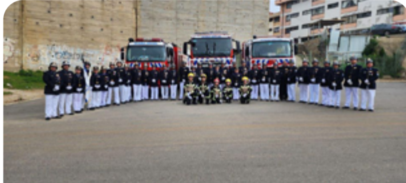
Decimoquinta Compañía del Cuerpo de Bomberos de Valparaíso, "Bomba Israel"

bía adoptado el nombre de Bomba Árabe, para fundar una compañía propia de la colonia judía. Tras superar los exámenes exigidos por la Comandancia, la Quinta fue reconocida oficialmente el 17 de marzo de 1955 y se incorporó en pleno al Cuerpo de Bomberos de Ñuñoa el 17 de abril de ese año.