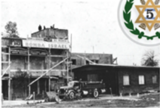
"Bomba Israel" de Ñuñoa.

Cada 30 de junio celebramos el Día del Bombero para honrar su labor, valentía y entrega. Es por eso que hoy queremos destacar que la institucionalidad judía en Chile ha aportado con cuarteles de bomberos en Ñuñoa y Valparaíso. La participación en la creación o funcionamiento de instituciones civiles que nada tienen de religioso, es un orgullo para nuestra comunidad.