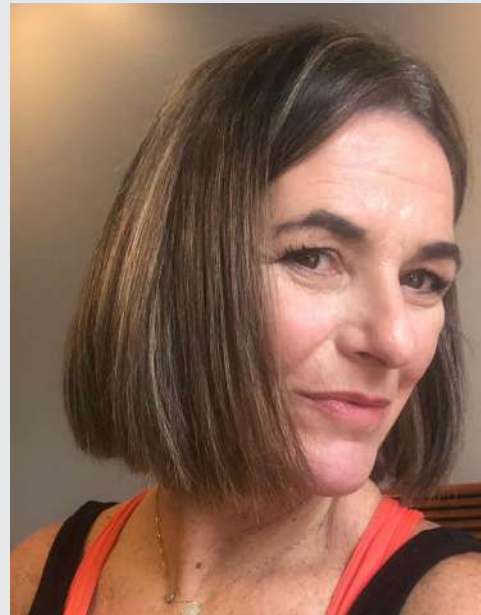
Por: Daniela Roitstein Directora CIS

En el libro Fragmentos de Cielo, del Rab Surazski, hay una explicación: La paciencia de Dios también tiene límites.