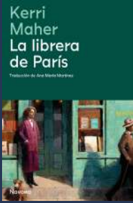
La librería de París Kerri Maher

Biblioteca Jaime Pollak Ganz (Solicitar en biblioteca@cis.cl) www.cis.cl