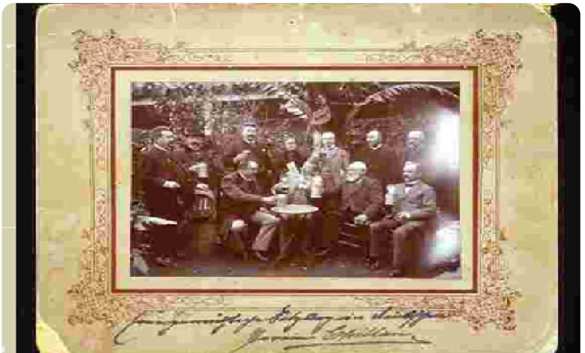
Encuentro en el Club Alemán de Chillán 1890