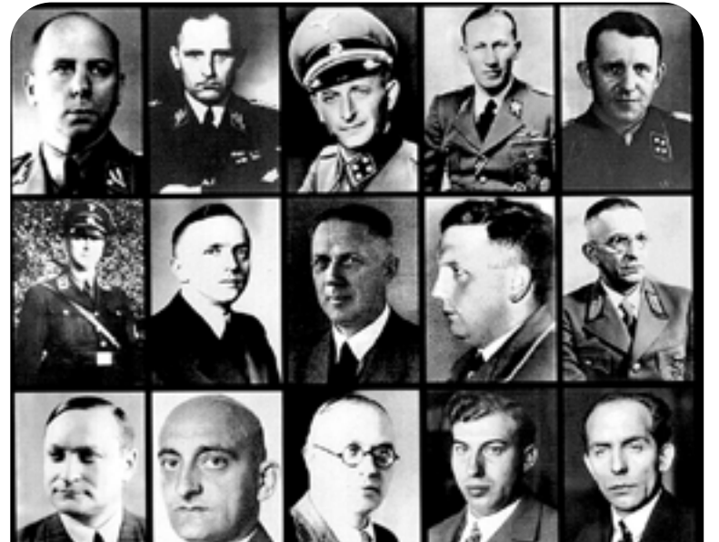
Dirigentes nazis que participaron en la Conferencia de Wannsee