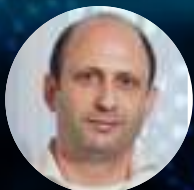
Noam Shomron Científico israelí