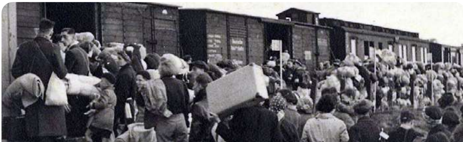
Judíos abordando un tren de deportación a Auschwitz-Birkenau

Fuentes consultadas: Yad Vashem, Enciclopedia del Holocausto del USHMM, Deutsche Welle