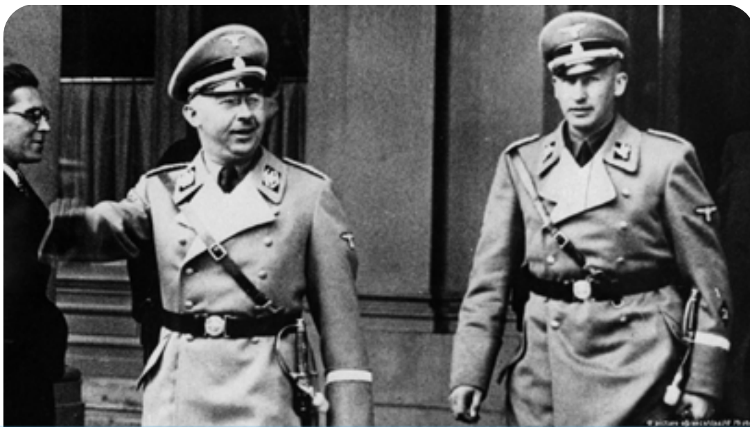
Reinhard Heydrich (der.) y el jefe de la Gestapo, Heinrich Himmler

Para instituciones como Yad Vashem la conferencia representa un momento en que la maquinaria del Estado nazi formalizó la planificación del genocidio.