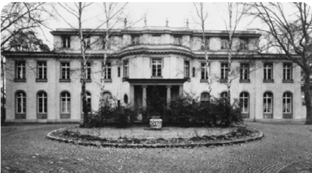
Lugar donde se realizó la Conferencia

Ese escalofriante eufemismo se refería a la eliminación sistemática del pueblo judío europeo, un genocidio sin precedentes.