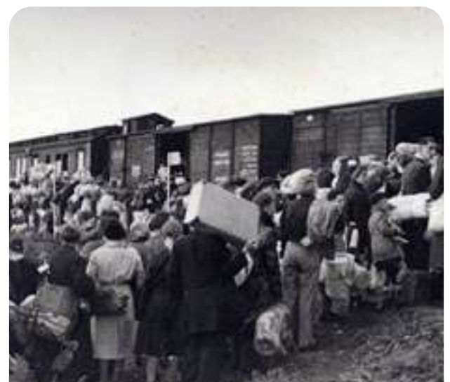
Aniversario de la Conferencia de Wannsee