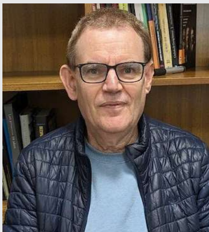
Por: Isaac Caro Profesor Titular Universidad Alberto Hurtado

Por lo tanto, estamos en presencia de un escenario regional, donde existen desde larga data conflictos irresolutos. Uno de los más importantes es el israelí-palestino, pero no es el único en la región. El enfrentamiento entre Arabia Saudita e Irán, representando a las dos corrientes principales del islam, sunnita y chiita respectivamente, ha dominado también el Medio Oriente. Ambos Estados han apoyado a facciones enfrentadas en los conflictos de Yemen, Irak, Siria y Líbano. Y, a pesar de que con la mediación de China, Teherán y Riad restablecieron sus