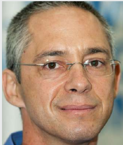
Por: GILAD SHARON*