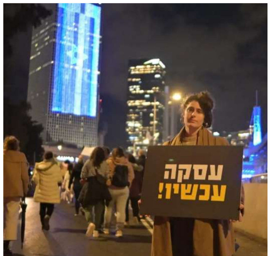
Mujeres protestan en Tel Aviv exigiendo la liberación de los secuestrados en Gaza