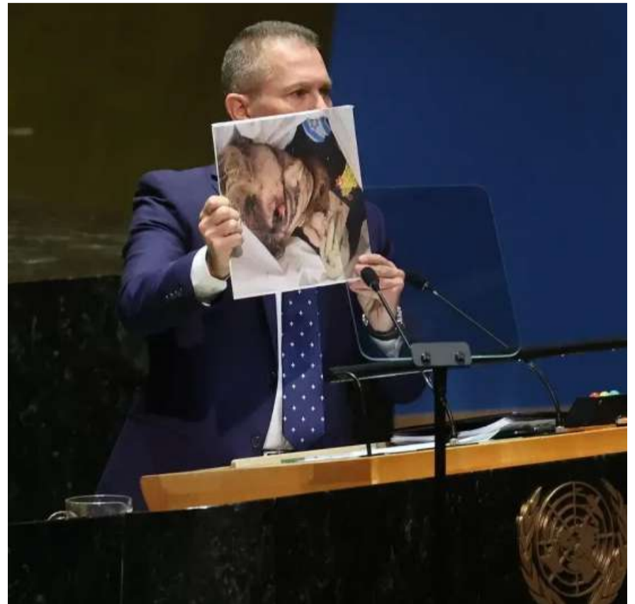
El embajador de Israel ante la ONU, Gilad Erdan, en una reunión de emergencia de la ONU el pasado mes de octubre.

Desafortunadamente, la organización que se estableció hace casi 80 años ya no es una fuente relevante de esperanza para las víctimas de abuso sexual. El resultado de la ONU se puede predecir fácilmente: la continuación de cerrar los ojos, taparse los oídos y el silencio atronador que no conducirá a la liberación de nuestras hermanas y hermanos del infierno de Gaza ni al fin de Hamás.