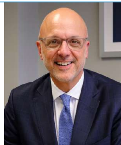
Ted Deutch Director ejecutivo del AJC.

Tras la publicación de la Estrategia Nacional de EE.UU. para Contrarrestar el Antisemitismo en mayo de 2023, el AJC creó y distribuyó una serie de guías para implementar las recomendaciones de la estrategia, y esta misma semana publicó un nuevo plan de acción actualizado para administradores universitarios con recomendaciones sobre medidas inmediatas y a corto plazo, y medidas de acción a largo plazo que los administradores pueden tomar para crear un plan de cambio duradero, incluida la aplicación de las reglas de protesta en el campus. El AJC sostiene que el liderazgo universitario tiene un papel singularmente importante que desempeñar para abordar el antisemitismo y garantizar la seguridad y el bienestar de los estudiantes, profesores y personal judíos.