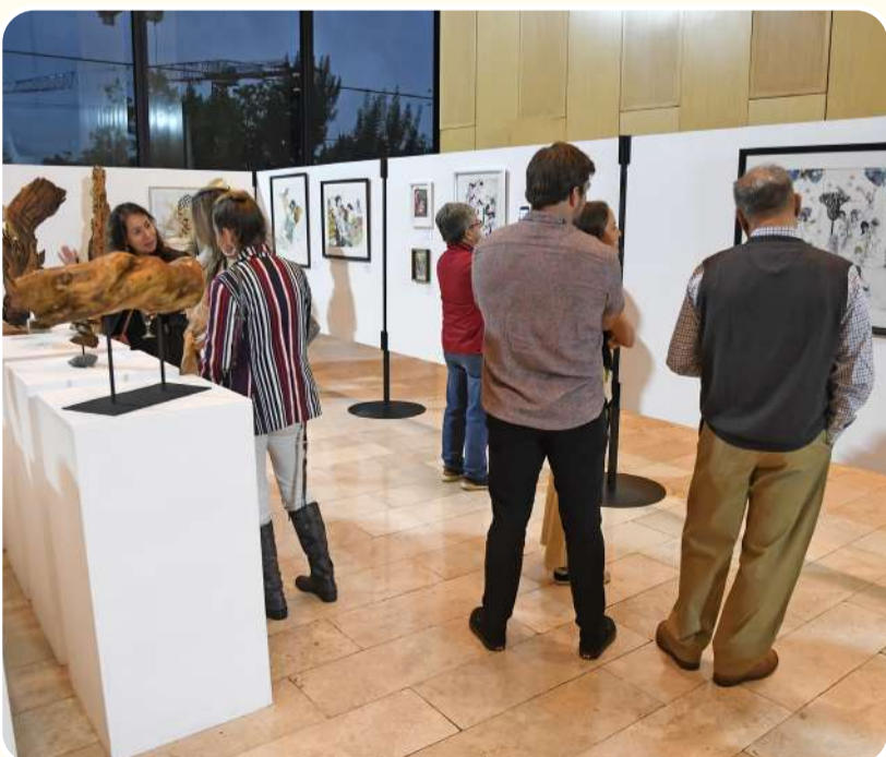
► Público asistente, admirando las obras presentadas.