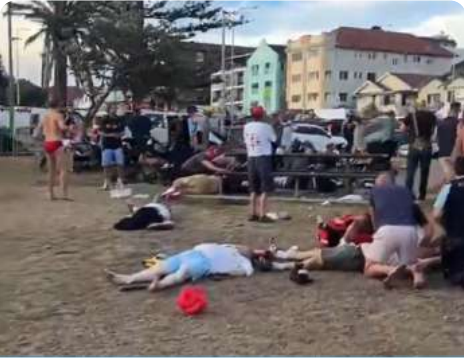
Bondi Beach, Sídney