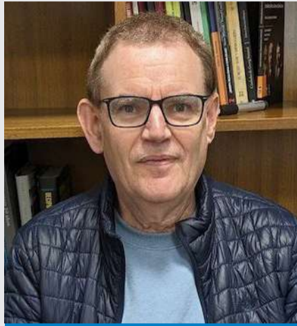
Por: Isaac Caro Profesor Titular Universidad Alberto Hurtado

¿Por qué el ataque a Rusia? Hay tres razones principales que explican la operación del ISIS en este país. En primer lugar, la potencia euroasiática constituye una civilización cristiana ortodoxa y, como tal, al igual que el conjunto del mundo cristiano, debe ser combatida y derrotada. En segundo lugar, Rusia mantuvo una guerra con la República de Chechenia, la que forma parte de la Federación Rusa, y tiene la característica de tener una población mayoritariamente musulmana. Existe una tercera razón que explica la irrupción del Estado Islámico en Rusia y que dice relación con la intervención