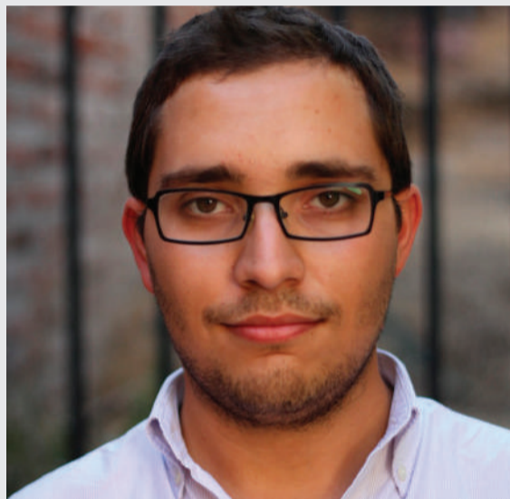
Por: MATT ERLANDSEN

Ahora que empezamos un nuevo año en el calendario judío, ¿cuál va a ser el propósito con que realmente nos comprometemos? Yo, por ejemplo, dejaré de consumir botellas plásticas no retornables.