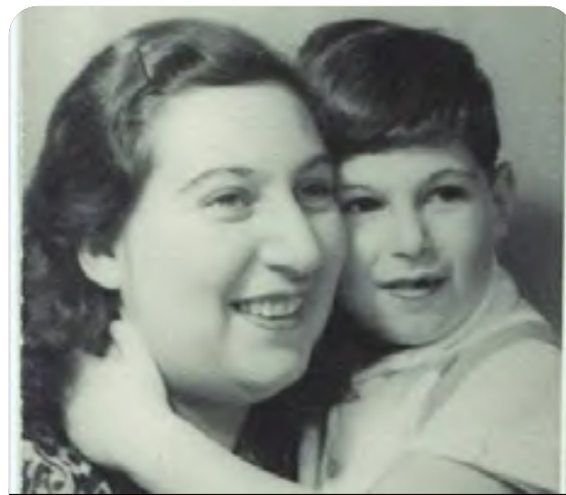
Fondo Kychenthal Hecht del Archivo Judío

SE SUMA AL PROGRAMA MEMORIA DEL MUNDO DE UNESCO