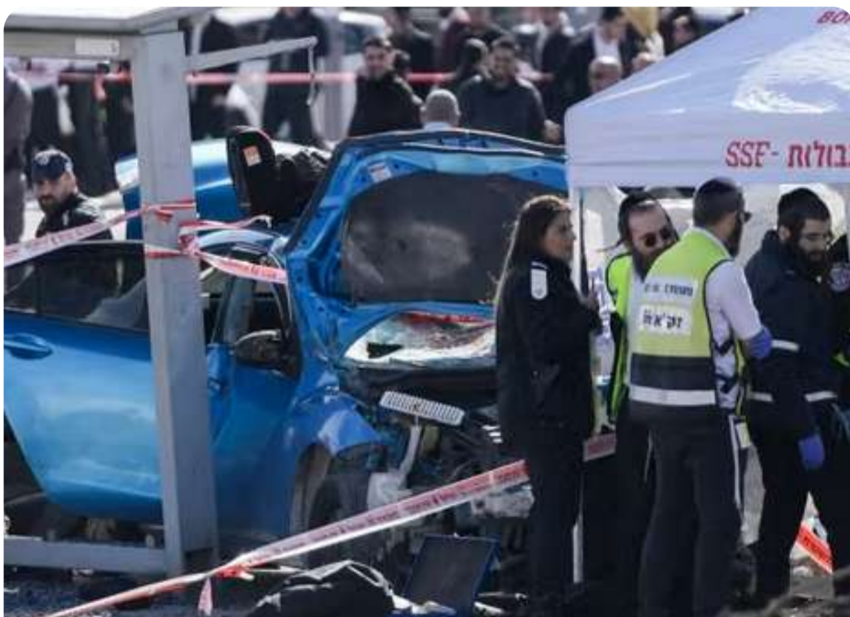
Ataque terrorista en Ramot, Jerusalem, febrero 2023