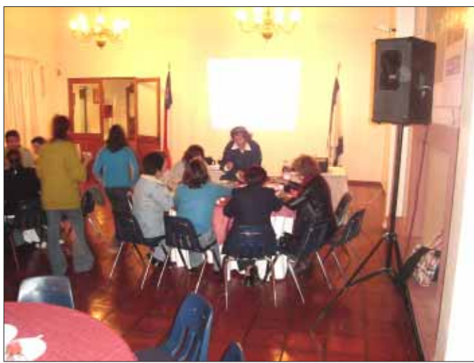
Los integrantes del Ulpán en actividades relacionadas con Israel.

—La idea es hacer otras actividades, pero primero vamos a ver cómo nos va con el esfuerzo del desfile. Tal vez podamos más adelante hacer la avant première de alguna película u organizar un bingo. Vamos a ver.