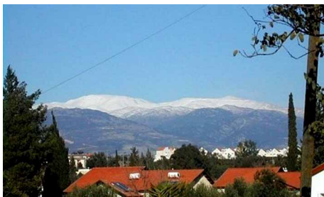
ALTURAS DEL GOLÁN.