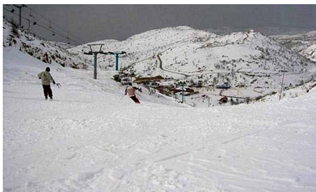
ESQUIANDO EN EL HERMON.

nicas donde no existían y los habitantes, sin distinción, disfrutan de los sistemas de bienestar social y seguridad de Israel que ha construido escuelas, salas de clases y que extendió la educación obligatoria de siete a 10 años y la secundaria la hizo extensiva también a la población femenina.