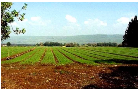
SEMBRADOS EN EL NORTE DEL GOLÁN.