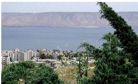
VISTA DESDE LA GALILEA.