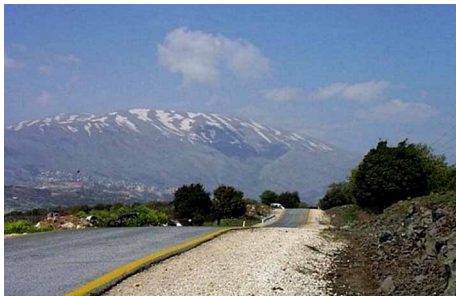
RUTA CONDUENTE A LAS ALTURAS DEL GOLÁN.

Hoy, aproximadamente, existen 16.000 habitantes drusos y musulmanes, que gozan de una absoluta libertad y que fueron abandonados por los gobiernos sirios, en contraste con Israel que ha invertido ingentes sumas de dinero en la instalación de servicios eléctricos, acueductos, construcción de clí-