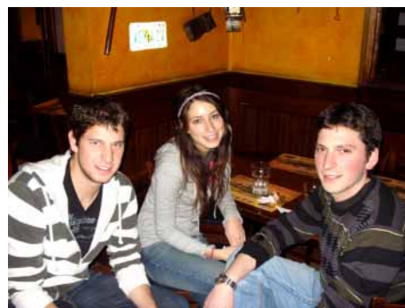
JÓVENES PARTICIPANTES EN PROYECTO «LÍDERES 3G».