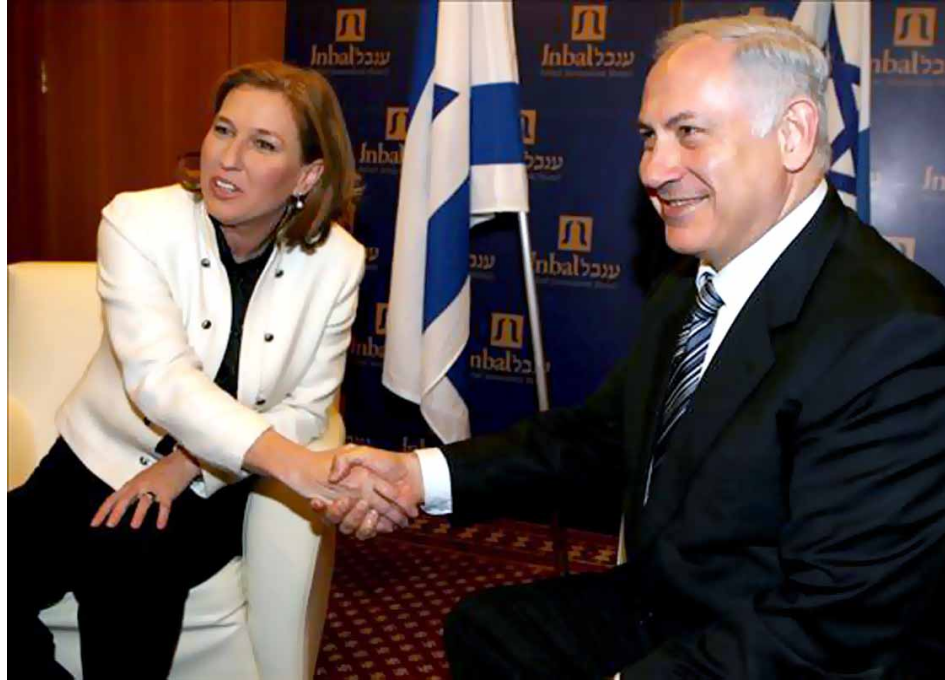
TZIPI LIVNI Y BENJAMÍN NETANYAHU.

Mofaz, número dos del partido, exigió a Tzipi Livni elecciones primarias en un plazo de tres meses y, en caso contrario, se separaría de la facción.