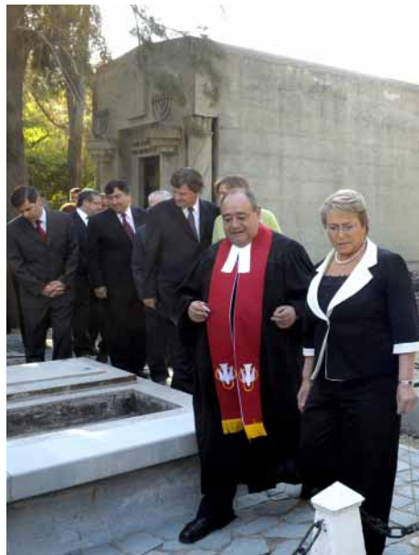
DIVERSOS ASPECTOS DE LA CEREMONIA ENCABEZADA POR LA PRESIDENTA DE LA REPÚBLICA, MICHELLE BACHELET.