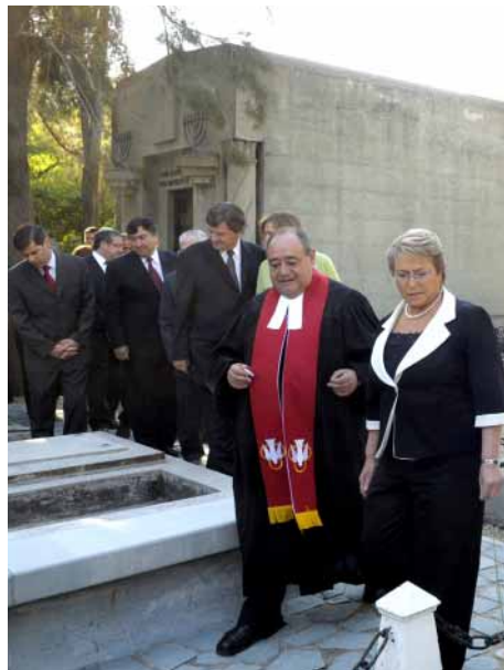
DIVERSOS ASPECTOS DE LA CEREMONIA ENCABEZADA POR LA PRESIDENTA DE LA REPÚBLICA, MICHELLE BACHELET.