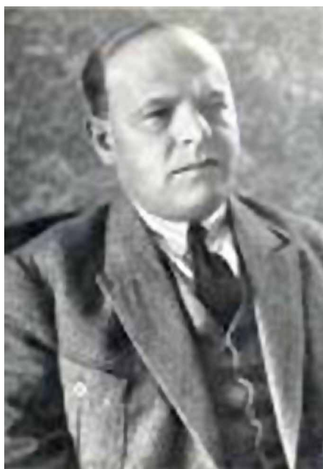
HAIM NACHMAN BIALIK

La poesía hebrea, escrita sin interrupción desde los tiempos bíblicos hasta el presente, aún a influencias externas y tradiciones internas. La poesía antigua, que incorporaba temas religio-