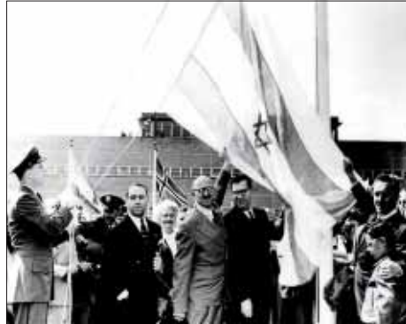
PROCLAMACIÓN DE INDEPENDENCIA DE ISRAEL EN LA SEDE DE LA ONU EN NUEVA YORK, EN 1948.

visitó los campamentos de refugiados en Alemania y otros países de Europa donde pudo constatar la deplorable situación en que vivían y el angustioso pedido de ellos para que se facilitara su traslado a Palestina.