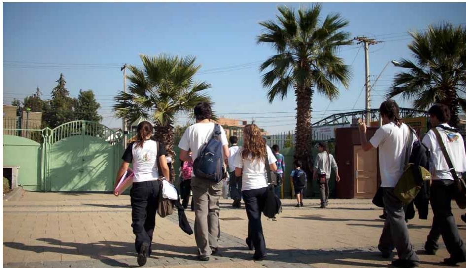
EN EL COLEGIO EL TEMA SE DA EN UN MARCO DE RESPETO.

—¿Cómo debe enfrentar la familia la sexualidad de los hijos que entran a la adolescencia?