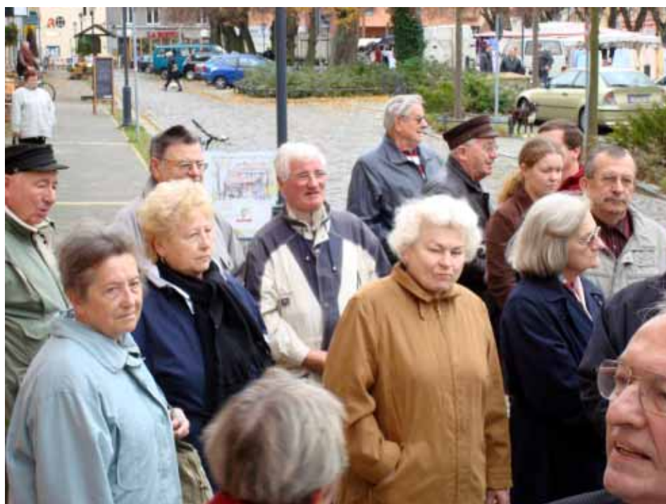
LOS ALEMANES EN LA POSTURA DE LA INSCRIPCIÓN DE LA CASA QUE PERTENECIÓ A LA FAMILIA TODTENKOPF.