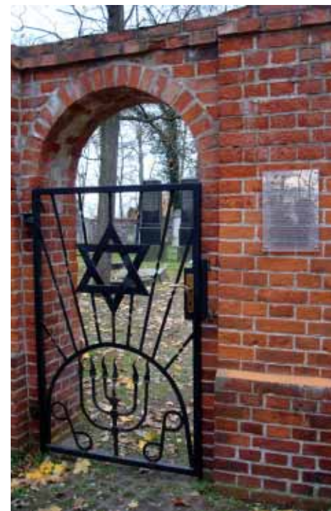
CEMENTERIO DE STORKOW CON LA MAYORÍA DE SUS LÁPIDAS EN EL SUELO.