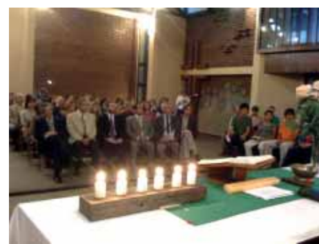
GRAN ASISTENCIA AL ACTO DE RECORDACIÓN.

to y la declaración Universal de los Derechos Humanos, promulgada por las Naciones Unidas hace exactamente 60 años como una consecuencia de los horrores de la Shoá y de la II Guerra Mundial.