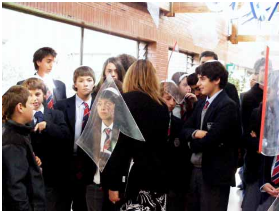
EN EL HALL DE ENTRADA SE INSTALARON ESTACIONES GUIADAS POR MONITORES DE LOS TERCEROS MEDIOS, QUIENES ATENDIERON A LOS ALUMNOS DE COLEGIOS INVITADOS.