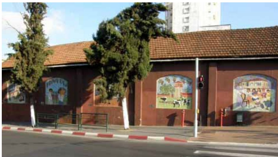
MUROS EXTERIORES DE LA VINERÍA CARMEL CONSTRUIDA EN 1902.

tonces árido territorio israelí, también se representó en uno de los murales, reproduciendo el momento histórico de la inauguración del primer estanque elevado sobre una torre y el pozo, en 1910. En 1883 se había construido la primera tubería de acero.