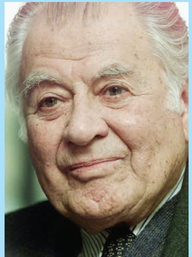
PATRICIO AYLWIN AZÓCAR

En esta solemne conmemoración, el ex Presidente de la República, don Patricio Aylwin Azócar, será distinguido con el Premio «Luz y Memo-