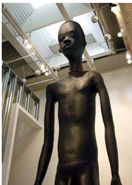
«EL NIÑO DEL SUR DE TEL AVIV», DE OHAD MERONI.

En la exposición se reúne trabajos ejecutados en una amplia gama de medios, tanto tradicionales como experimentales, de cuarenta artistas, con cerca de sesenta obras cuidadosamente seleccionadas. Todos ellos se han