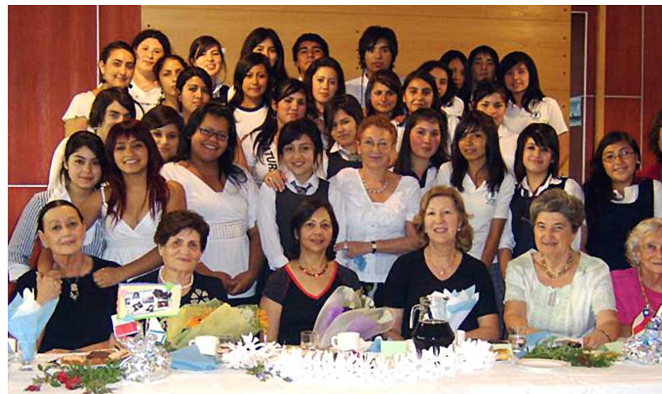
REUNIÓN DE LA FAMILIA CEFI DURANTE LA FIESTA DE FIN DE AÑO.

El calendario ha corrido con rapidez y llegó la fiesta de fin de año en la que nuestros becarios comparten con sus padrinos. Fue el martes, 25 de noviembre, en que toda la familia CEFI se reunió en una alegre tarde, con los 30 alumnos (de 32) de educación secundaria, de nuestras escuelas de la Región Metropolitana, pudiendo comprobar una vez más el entusiasmo con que ellos aprecian y admiran la cultura judía.