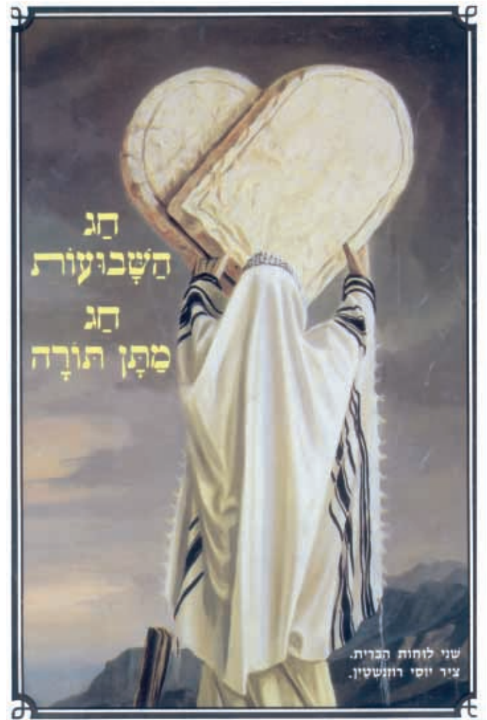
«Las Tablas de la Ley», pintura de Iosi Rosenstein.

Mientras en África y en otras partes del mundo las guerras dejan cientos de miles de muertos y otros tantos mutilados y sin hogar, y en tantos países vemos que se matan sólo por un partido de fútbol, nos acordamos que en el judaísmo hay que transgredir todas las mitzvot (preceptos) con tal de salvar una vida humana, a excepción de tres, una de las cuales es: si te obligan a matar a otro (que no te ha agredido y por lo tanto no es en defensa propia)