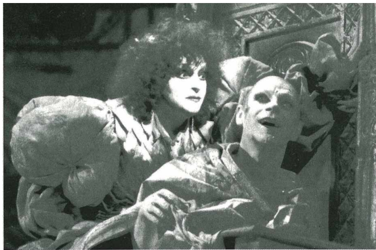
Con Lindsay Kemp, en Salomé , Milán, 1979.